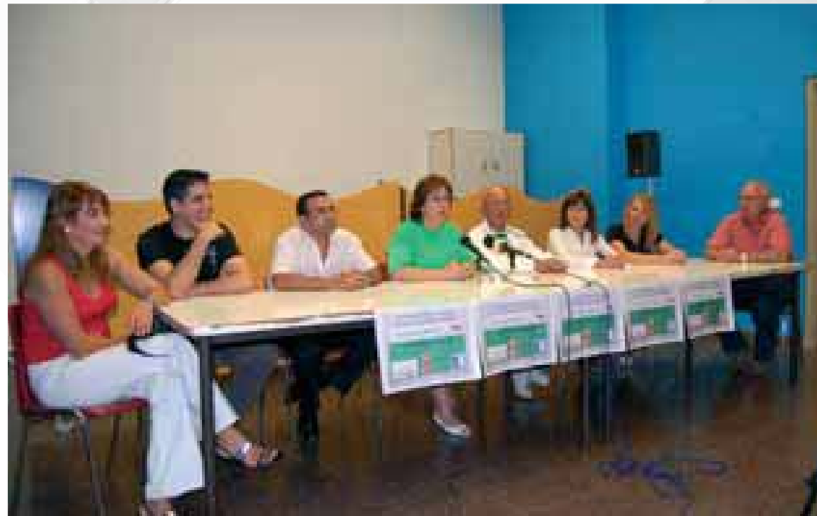
Día de la Familia de Almansa