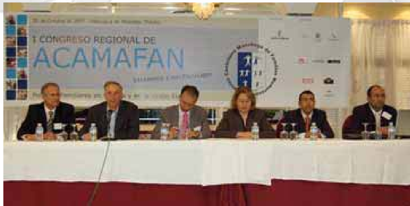
I CONGRESO REGIONAL DE FAMILIAS NUMEROSAS Octubre 2007