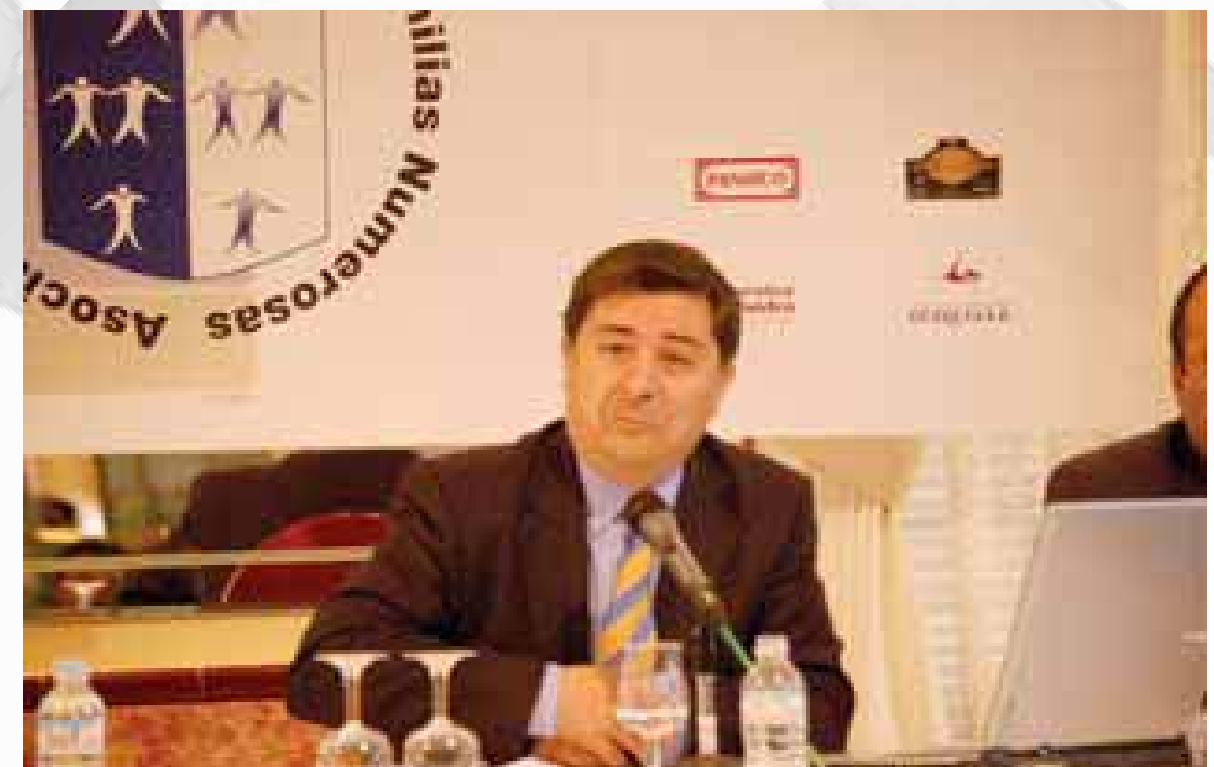
Ponencia "políticas de familia en España y Europa"