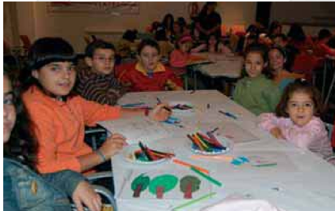
Día de la Familia Tomelloso