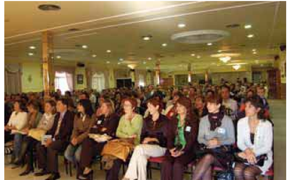
SALÓN DE ASISTENTES