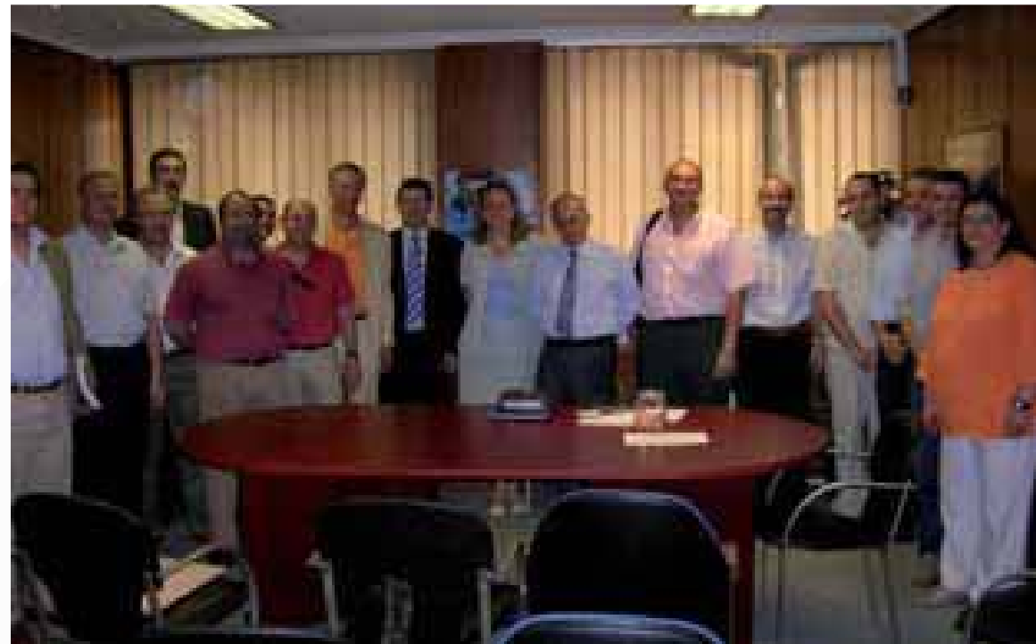
Acamafan con la junta de la Federación Nacional de Familias numerosas y otras asociaciones