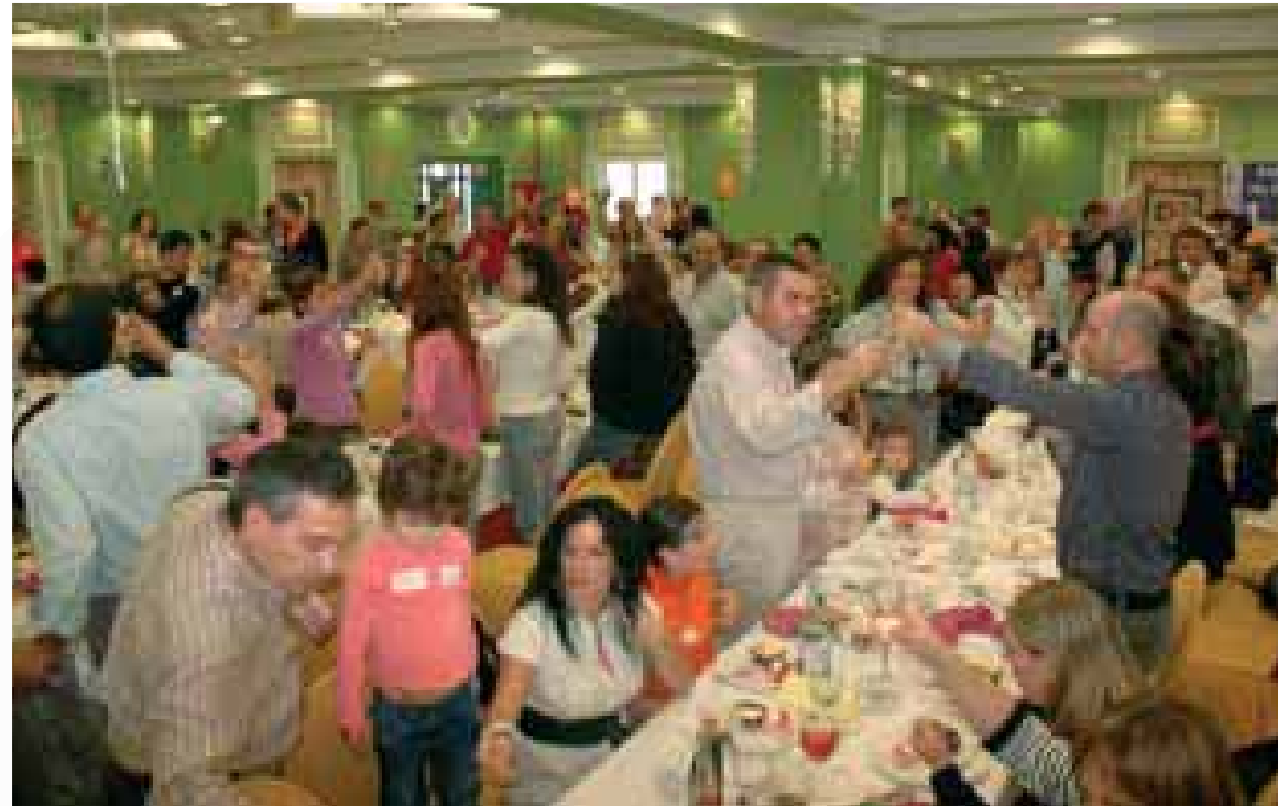
Día de la Familia Toledo