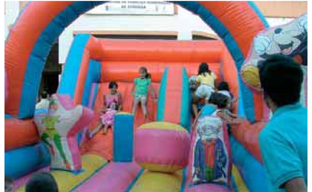
Día de la Familia Sonseca