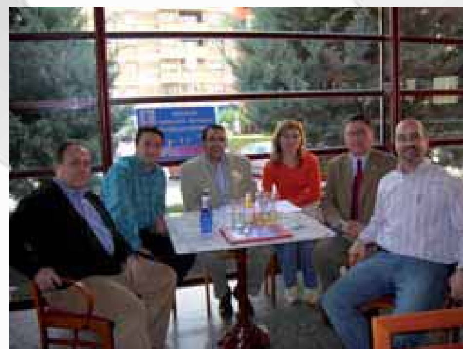
Junta directiva de ACAMAFAN con Representantes de Asociación Provincial de Cuenca.