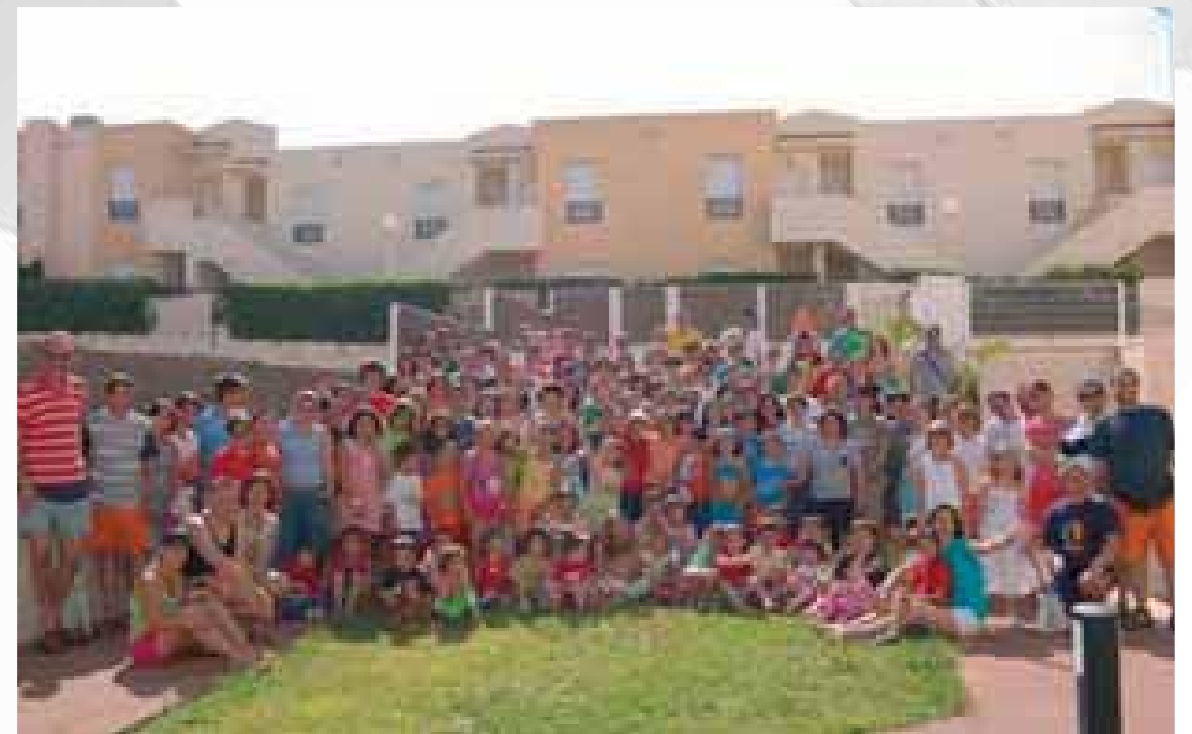
Vacaciones Talavera de la Reina