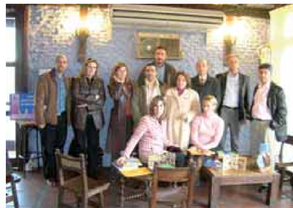
Junta directiva de ACAMAFAN con Representantes de Asociación de Guadalajara.