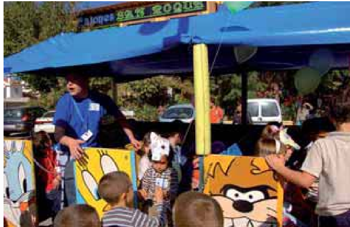
Actividades I Congreso Regional