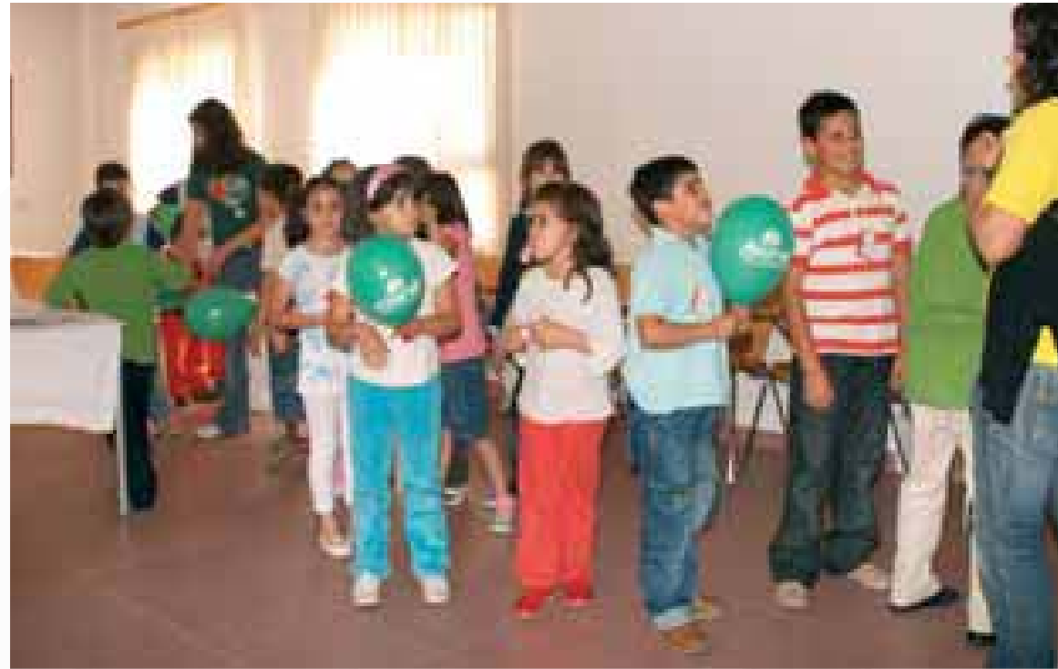
Día de la Familia Talavera de la Reina