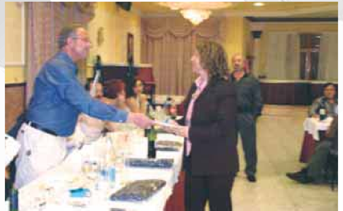
Día de la Familia Villanueva de Alcardete